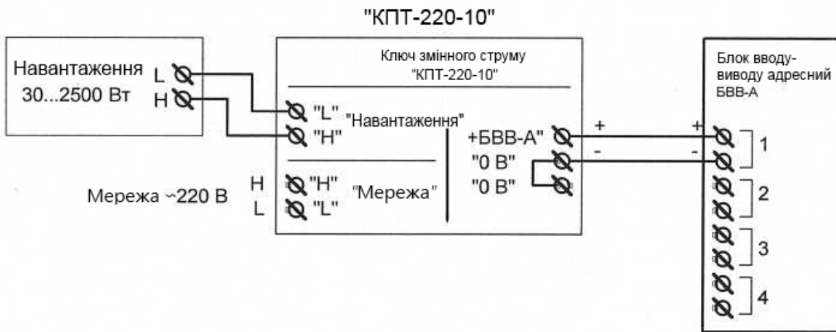
Схема підключення навантаження до «КПТ-220-10»